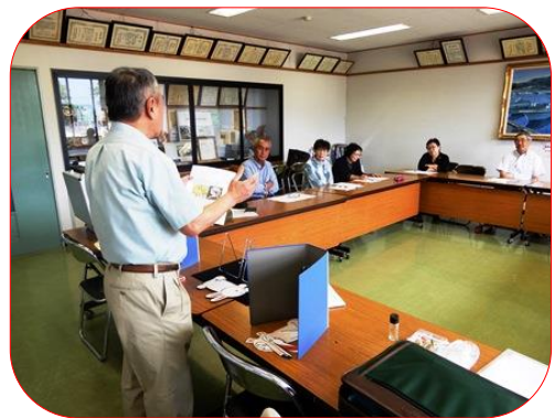
6月16日実施の駅からウォーク 砂子浜 大家(千田家)