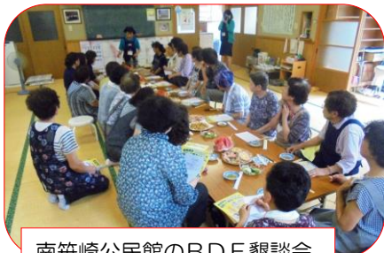
南笹崎公民館のBDF懇談会

事業所や家庭から出る廃食油を回収し、精製処理することによって、エネルギーとして再利用できる「バイオディーゼル燃料(BDF)」の普及を目指す懇談会(主催:環境パートナーシップいわて)が、9月15日盛町のシーパルで、振興局や2市1町の担当者等の参加で行われました。