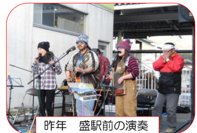
昨年 盛駅前の演奏