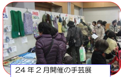
24年2月開催の手芸展

夢ネット大船渡は気仙市民復興連絡会の中心的活動のかたわら、ジャパン・プラットフォームから助成を受けて、平成 23 年 7 月から仮設住宅のパトロールを行い、仮設住宅入居者から色々の要望を聞き、関係機関への橋渡しや、特に女性から「手芸用品」の要望を受け、ネットで支援を求めた結果、全国から物資を贈って頂き、約 200 名を越す方へ、布や針さらにミシン等も届けました。