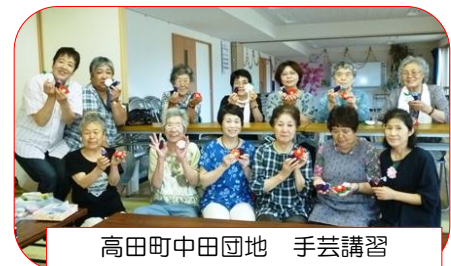
高田町中田団地 手芸講習

仮設住宅での趣味を生かした女性の生きがい支援として、平成 24 年 4 月から手芸講習を始めました。住田町の中上仮設の方は「手芸に夢中になっていると、色々の辛いことを忘れてよい。月 1 回であるが翌月が待ち遠しい」と言ってくれるほど、夢ネット大船渡の手芸講習は好評に継続中、今年度は 1ヶ月 25 力所の開催計画で行い、今年 12 月ころに延べ開催 800 回目となります。