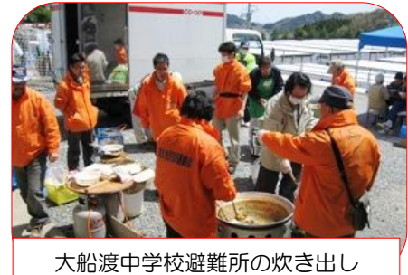
大船渡中学校避難所の炊き出し

当初事務所を YS センターの奥の部屋をお借りしていましたが、余震で危険な部屋となったため、愛知ネットが末崎町字船河原へコンテナハウスを建て、気仙市民復興連絡会の事務所として、被災者支援活動の拠点として平成 23 年 12 月まで利用しました。