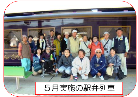
5月実施の駅弁列車

今度来るときは、大船渡が変わっている姿や三鉄が盛り上がっている姿を見ることです。本当にありがとうございました。また、熊本災害に支援して下さいました人々に、熊本を代表してありがとうございました。岩手の皆さんがばって下さい。福岡県 Uさん (2016年6月18日記載)