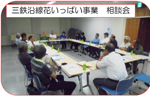
三鉄沿線花いっぱい事業 相談会

①千葉県小湊鉄道沿線に花づくりを行っている方を迎えて講演会を開催する。②沿線に1ヵ所「三鉄沿線花を飾ろう」との看板を設置する。③自宅に桜・梅・桃・紫陽花等の木の苗を植えたい方を探し、苗木を贈る。④スイセン球根、コスモスや菜の花などの種を植える等です。