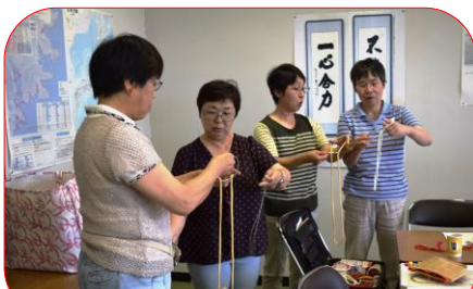
マジック講習会 於：大船渡地区公民館