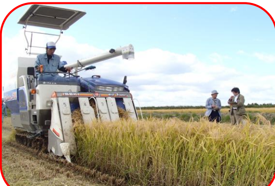
BDF（バイオディーゼル燃料）で動く農機具

10月7日、NPO 法人環境パートナーシップいわて主催のエコツアーが開催され、夢ネット大船渡から3人、約20人が出席しました。今回のエコツアーでは遠野市の障害者支援施設『石上の園』を訪問。大船渡市で11月2日から回収される使用済みてんぷら油は、『石上の園』で精製され、新しくBDF（バイオディーゼル燃料）として生まれ変わります。