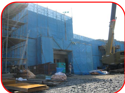
建設中の県営災害公営住宅（綾里）

第2回復興の現場見学会が9月30日に開催され、市民や復興支援従事者など17人が参加しました。今回は大船渡市三陸町綾里地区の災害公営住宅（建設中）や集団移転の現場、大船渡港湾口防波堤を見学しました。