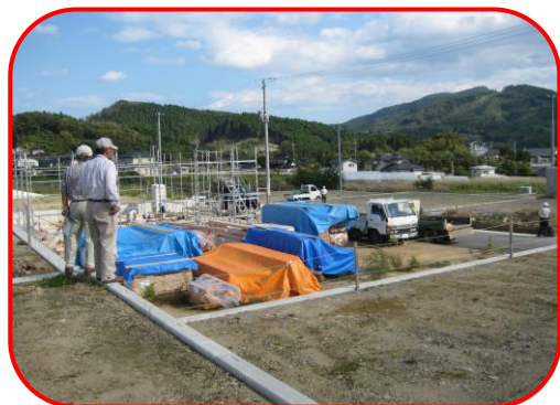
防災集団移転地（三陸町 港・岩崎地区）

綾里の災害公営住宅は県が建てた後、大船渡市に譲渡され、市が管理する予定。建設戸数は2DK21戸、3DK9戸の計30戸。