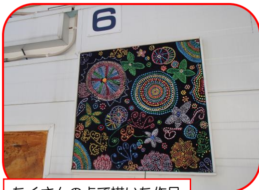
たくさんの点で描いた作品