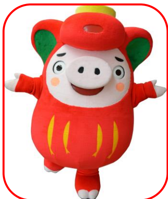
大船渡市PRキャラクター (おおふなトン)

ゆるキャラの頂点を決める『ゆるキャラ®グランプリ2014』。今年は全国から、なんと1670キャラがエントリーしました！岩手県からは15キャラ、気仙地域からは4キャラが出場しています。『ゆるキャラで地域を、会社を、日本を元気にしよう』とみなさん頑張っています。みんなで応援しよう！！