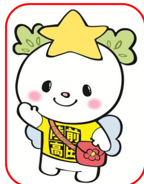
陸前高田市マスコットキャラクターたかたのゆめちゃん

希望の一本松の上に住む妖精☆陸前高田市ゆめ大使のゆめちゃんです☆未来を担う子どもたちの夢や希望を叶えるために、子どもたちの応援団長をしてるんだよ♪