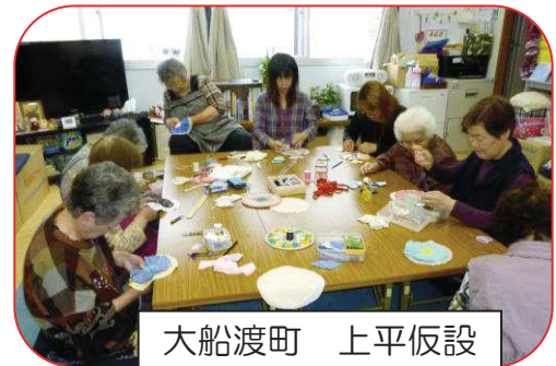
大船渡町 上平仮設

どこの講習でも、夢ネット大船渡の手芸講習を楽しみに待っていて大変喜んで頂いています。仮設の集会所へ集まって「しゃべって・笑って・賑やか」いい雰囲気で開催しています。