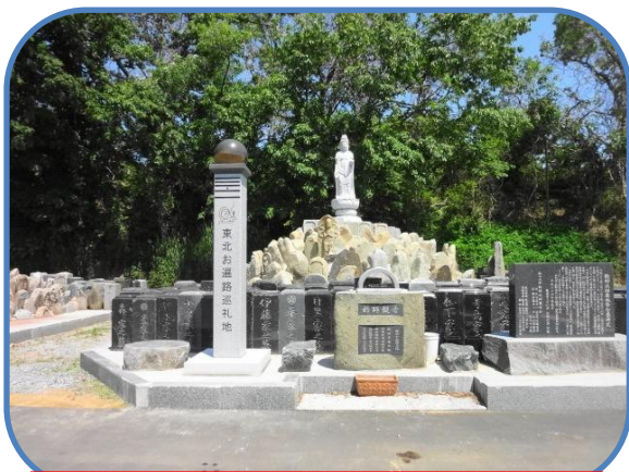
相馬郡新地町龍昌寺の第一号標柱

2011年3月11日、東北地方を襲った未曾有の大震災は、長年いつくしんできたものを一瞬のうちに奪い去ってしまいました。