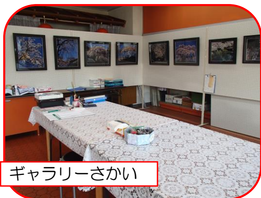
ギャラリーさかい