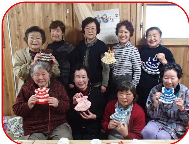
住田町の中上仮設で行われた手芸講習

夢ネット大船渡は、ジャパン・プラットフォーム(JPF)様からの助成を受けて、仮設住宅集会所での「手芸講座」を、平成25年度130回(参加者延べ1022人)行う事ができ、仮設住宅の皆様から大変喜んでいただきました。