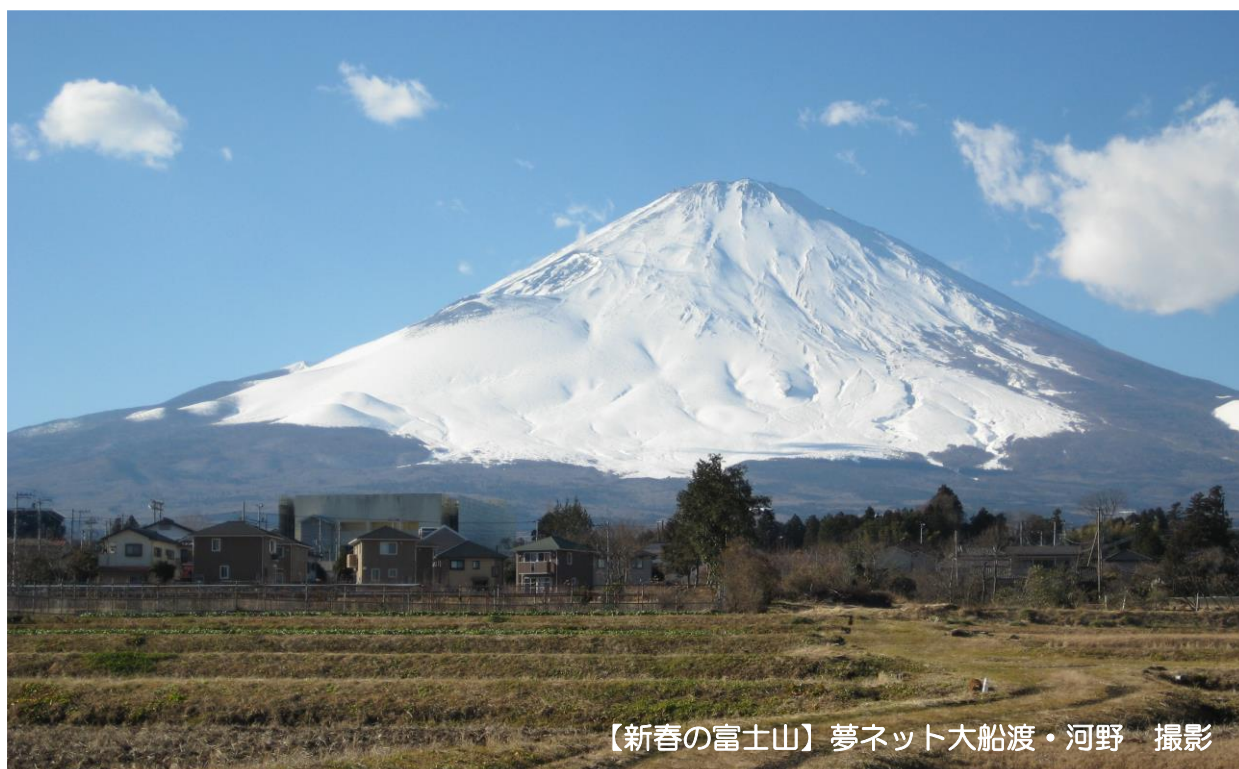
【新春の富士山】