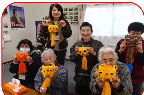
完成したふくろうと一緒にポーズ☆

大船渡市三陸町綾里の黒土田仮設では、12月3日、かぎ編みで『ふくろう』を作りました。このふくろうは、小物入れにもなって便利なのです。