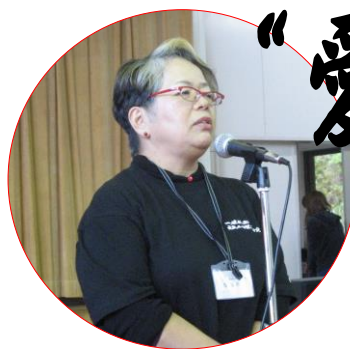
写真：森重子理事長