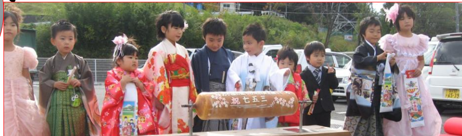
昨年の高田町大隅つどいの丘商店街での七五三着付・写真撮影