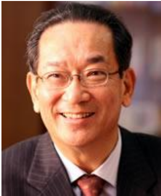
「新しい日本をつくる国民会議」(21 世紀臨調) 代表、