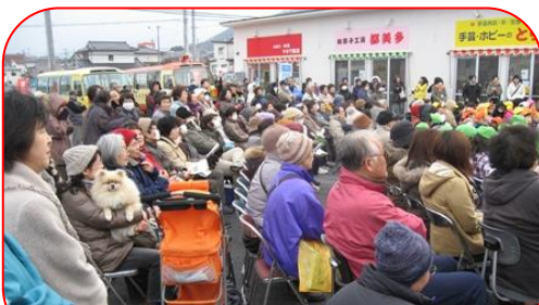
今年 3 月の地の森八軒街のイベント