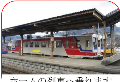
ホームの列車へ乗れます

11：30～ サンタさんのクリスマスプレゼント、 ＜昼食休憩＞ 13：00～ 朗読会、 13：30～ 松ボックリクリスマスツリーづくり、 14：00～ サンタさんのクリスマスプレゼント、 横浜ドイツ人学園のケーキ、綿アメ、シチュー等の さまざまなお楽しみあります。 多少ですが救援物資もあります。 多くの方々と共にクリスマスをお祝いしましょう。