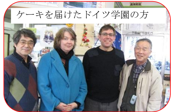
ケーキを届けたドイツ学園の方

11：30～ サンタさんのクリスマスプレゼント、 ＜昼食休憩＞ 13：00～ 朗読会、 13：30～ 松ボックリクリスマスツリーづくり、 14：00～ サンタさんのクリスマスプレゼント、 横浜ドイツ人学園のケーキ、綿アメ、シチュー等の さまざまなお楽しみあります。 多少ですが救援物資もあります。 多くの方々と共にクリスマスをお祝いしましょう。