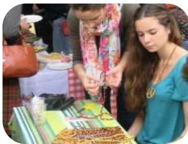
ブレッツェルの首飾りづくり