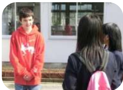
12歳イケメン君 女子高生の人気者