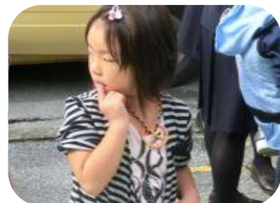
首飾り、お似合いです