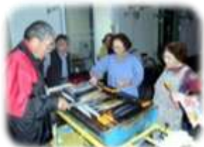
10/16 大船渡・富沢仮設サンマ焼き 初めてのイベントにみんな楽しそう