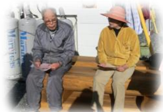
秋の日の午後、日なたぼっこ (大船渡市内・地ノ森仮設)