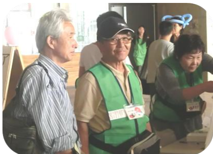
「夢ネット」のブースでの津波映像説明

「愛知でできる東北支援」をテーマに、東日本大震災で被害の大きかった東北に焦点が絞られ、ここ気仙からもたくさんの団体が参加・出展して、復旧・復興へむけた歩みを東海地方の皆さんにアピールし、今までのお礼とともに、継続的な支援を呼びかけました。(右ページへ)