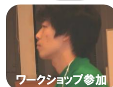
ワークショップ参加 大学生・Sくん