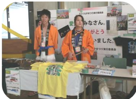
陸前高田「動く七夕まつり実行委員会」