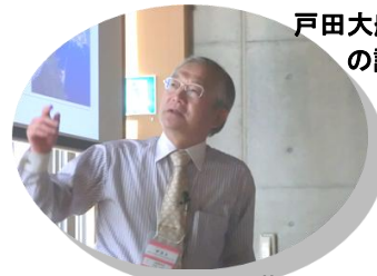
戸田大船渡市長の講演