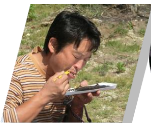
サンマ、どえりやーうみやーで