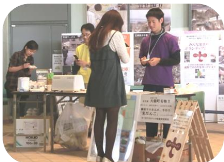
お向かいは「遠野まごころネット」さん