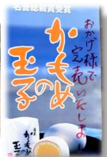
かもめの玉子 完売 「気仙きらめき大学」