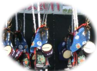
愛フェス ステージでの住田町鹿おどり 亡くなった人を悼む「鎮魂の踊り」