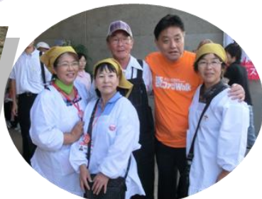
河村名古屋市長と「サンマ婦人会？」