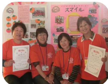
「子育て支援スマイル」4人娘？