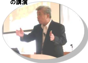
多田住田町長の講演

みなさん本当にありがとうございます。みなさんの気持ちに支えられて、東北は、気仙は、かならず復旧・復興します。見ていてください。