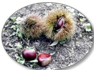
連絡会事務所そばの栗の実 秋の深まりを感じます