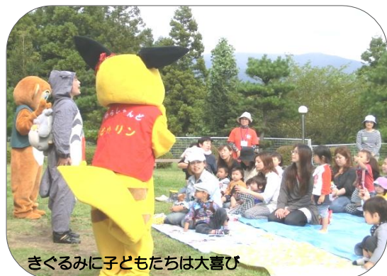
きぐるみに子どもたちは大喜び

9月26日(月)大船渡市立根町の福祉の里公園で、「子育てサポートスマイル」主催の子育て支援の集いが行われ、秋晴れのもと30組ほどの親子連れが集まりました。集いでは、読書ボランティア「おはなしころりん」から絵本・手づくりパン・お菓子が配られたほか、内陸部の子育てサポート「わらしやらんど」と奥州市社協の協力で「着ぐるみニコニコ一座」も登場。子どもたちは大喜びでした。終了後は紙おむつ・ミルクなどの支援もあり、お母さん達も笑顔でした。〈熊谷〉