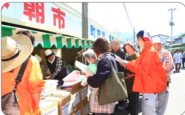
[復興ニュース]を配りながらタオル配布