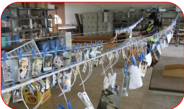
洗浄した写真を影干