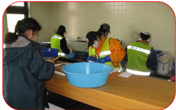
写真をぬるま湯で洗浄