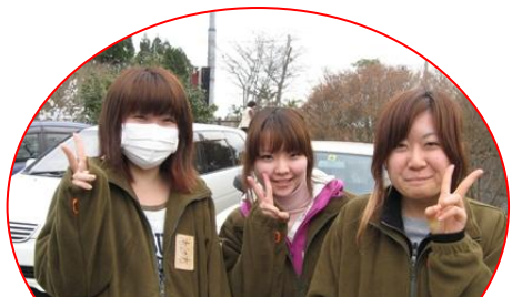
愛知ネットのボランティアとして 支援に来た大学3年生3人

4月21日、連絡会の会議終了後に、大船渡市を訪問し、災害復興部長へ（市長上京により不在）気仙市民復興連絡会の目的から今後の事業等の説明をおこない、新しい発想による復興計画づくりに協力することを申し入れた。